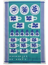
241-0049 ポーセリンのキッチン