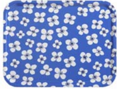
225-0020 トレー「ベラミ」 48 x 43cm 価格:7,560円 ロット:4

ベラミ マリアンヌ・ウェストマンのデザインした『ベラミ』シリーズ。1950年代に誕生したこのデザインは、ブルーの地になんともかわいらしい白い花びら。これは、スウェーデンの桜の花です。シンプルなデザイン、そしてブルーxホワイトのシンプルなカラーがおしゃれです。