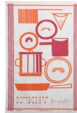
241-0051 ポットのキッチン