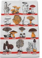
241-0053 「キノコファミリー」