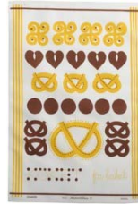
241-0050 ベーキングのキッチン