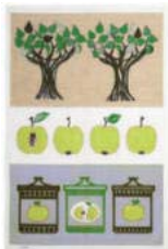
241-0048 「アップルジャム」 グリーン Design studio