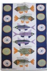
241-0062 フィッシング・トリップ Ulla Bäärnhelm