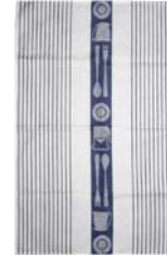
241-0057 「ティーポット」ブルー