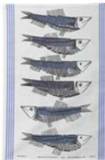
241-0056 キッチンタオル「流れへの抵抗」