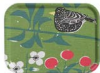
225-0023 トレーS「チェリーガーデン」グリーン 27 x 20cm 価格:3,990円 ロット:4