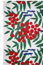
241-0060 「フォックス」 レッドxグリーン Kerstin Broulonger