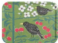
225-0024 トレーL「チェリーガーデン」グリーン 48 x 43cm 価格:7,560円 ロット:4

ふっくらとしたかわいらしい小鳥たちが桜の木でのんびりくつろぐ様子をうまく表現しています。絶妙な配色バランスが心地よく、いつまで見ても飽きないデザインです。