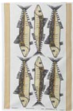
241-0055 キッチンタオル 「スモークフィッシュ」