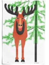
241-0061 「フルートのルーベン」 Jukomero