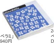
242-0007 ペーパーナプキン「ベラミ」 D17cm 価格:1,155円 ロット:12