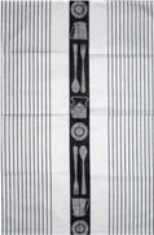
241-0058 「ティーポット」ブラック