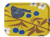
225-0025 トレーS「チェリーガーデン」イエロー