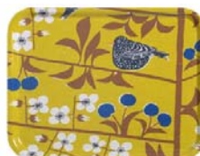
225-0026 トレーL「チェリーガーデン」イエロー