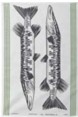
241-0054 キッチンタオル 「フィッシュアドリーム」 70 x 47cm 価格:1,995円 ロット:6

メニュー この『メニュー』シリーズは、料理好きなマリアンヌが実際にキッチンで使った魚たちをユニークに表現しています。リアルなようにやっばりデフォルメされた魚たちが独特な雰囲気です。