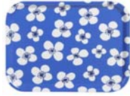
225-0019 トレーS「ベラミ」 27 x 20cm 価格:3,990円 ロット:4