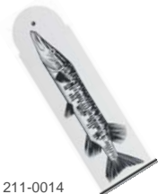
211-0014 ボードロング 「フィッシュアドリーム」 53 x 17cm 価格:7,140円 ロット:4