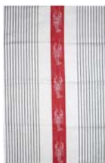
241-0059 クレイフィッシュ

アストリッド・サンペのシンプルなシリーズが復活しました。クラシックな定番デザインです。